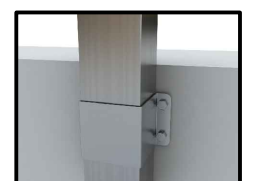
1010-15 (u) Anclaje suelo